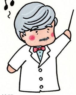
正面ホール特設ステージ